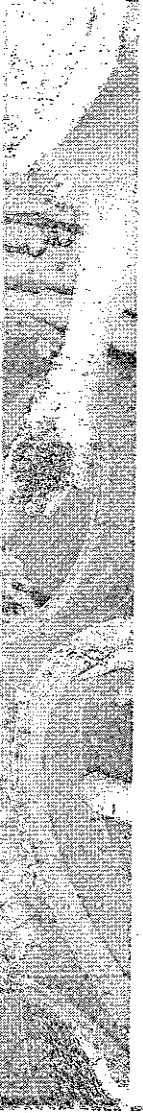
MARCIA KAFENSZTOK, produtora rural em Tibau do Sul (RN)

pela exportação brasileira de melão, manga e uva do Brasil, além da produção de diversas outras culturas para o mercado interno", reforçou.